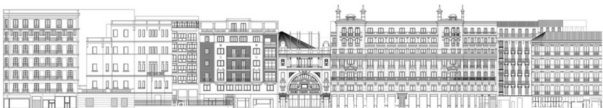
Alzado Desarrollado a C/ Alcalá