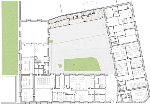
Planta Baja Conjunto