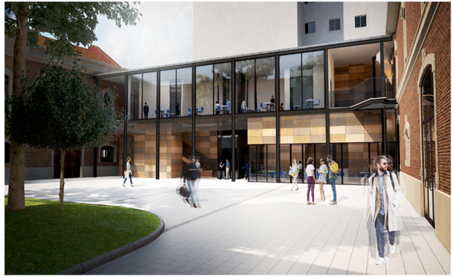
Vista del Patio hacia el Este

Promotor Universidad Antonio de Nebrija Tipo Equipamiento Docente Estado En Tramitación Superficie 4.591,68 m 2