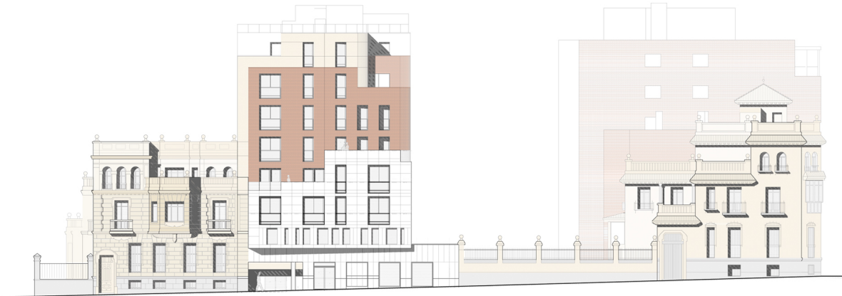
Alzado a C/ Principe de Vergara